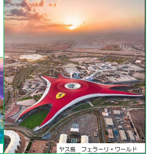
ヤス島 フェラーリ・ワールド