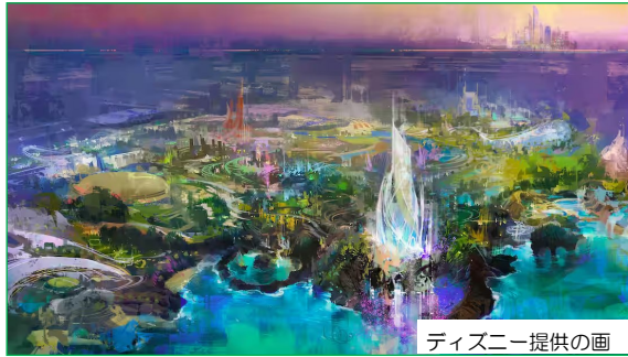
ディズニー提供の画

観光・AI両面で未来志向の取り組みが進むUAEの動向から、今後の市場展開のヒントが得られそうです。