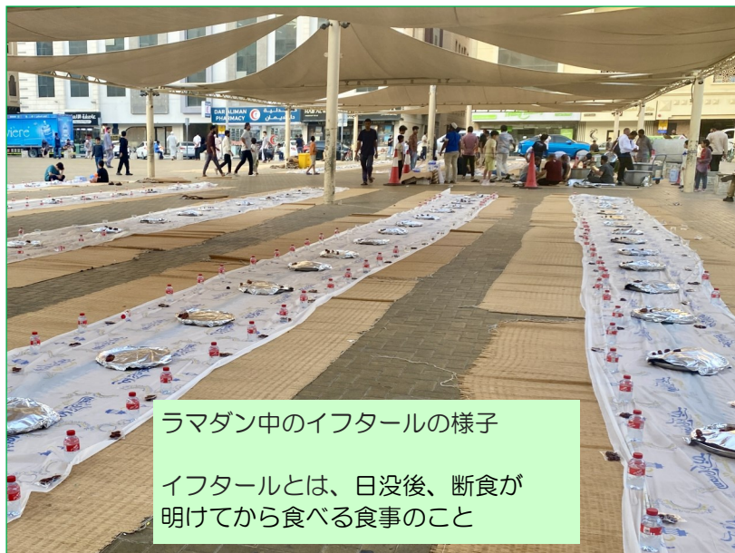
ラマダン中のイフタルの様子

Kaiho Middle Eastの畳谷です。今年は2月28日から3月29日頃までラマダンがありました。期間中は、日中の断食による疲労や集中力の低下から交通事故が多発します。私自身も事故を2度目撃し、何度も隣のレーンの車と接触しそうになりました。こうした背景の中、ドバイでは2030年までに全交通手段の25%を自動運転化する戦略を推進しており、交通事故の削減や排出ガスの低減、移動効率の向上などが期待されています。去年はDENSOのセーフティ&コックピットシステム、アブダビの自動運転タクシーも体験し、技術の進化と中東市場の可能性を肌で感じました。